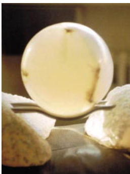
„Kugel im Licht“