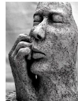
Skulpturen Samira Klaho Recklinghausen