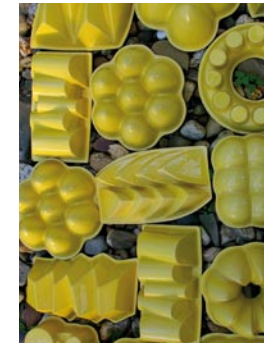
Keramik Detlef Kunen Dülmen